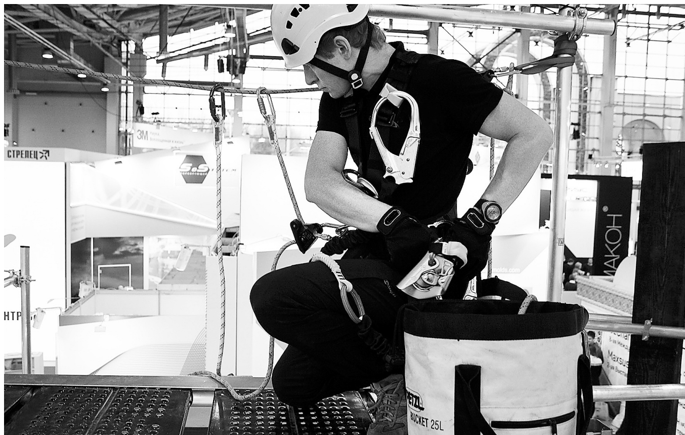
Ежегодно в рамках форума проходит обучение и демонстрация работ на высоте

Стали известны даты проведения Международного форума «Безопасность и охрана труда». БИОТ – 2020 состоится в Москве с 8-го по 11-е декабря 2020-го года.