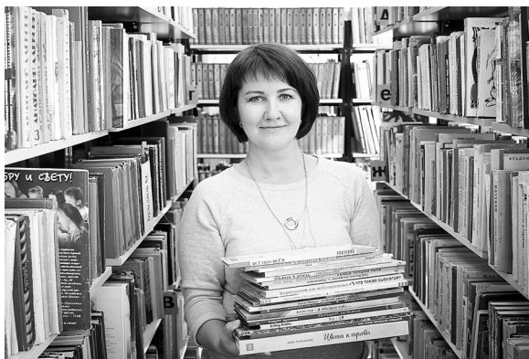
7 % респондентов согласны на небольшой доход при условии минимальной ответственности на работе

Большинство опрошенных россиян согласны брать на себя ответственность и много трудиться ради высоко-го заработка. Об этом свидетельствуют данные опроса на портале Роструда «Работа в России».