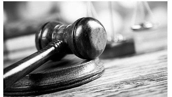
Законопроект устанавливает сроки, в которые можно обратиться за судебным взысканием компенсации морального вреда

сации морального вреда в связи с нарушением трудовых прав. Работник сможет подавать иск либо одновременно с требованием о восстановлении нарушенных трудовых прав, либо в течение трехмесячного срока с момента вступления в законную силу решения суда, которым эти права были восстановлены полностью или частично.