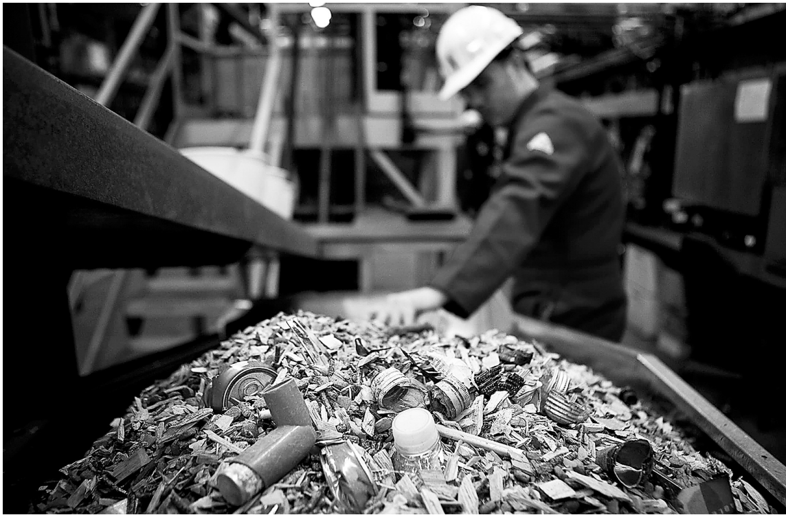
Для совершенствования инфраструктуры переработки ТКО потребуются значительные инвестиции

Как отметил председатель Российского экологического общества, заместитель председателя общественно-делового совета национального проекта «Экология» Рашид ИСМАИЛОВ, в современных экономических условиях промышленным предприятиям важно сосредоточить внимание на сохранении окружающей среды, стабилизировать воздействие на экологию.