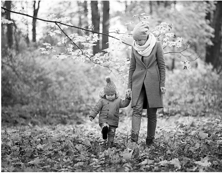
Прогулки в осеннем парке укрепят иммунитет

✓ Прогулки. Свежий воздух поможет насытить кровь кислородом и укрепить иммунитет. Гулять лучше вдали от автострад, в парках и скверах. Одеваться нужно по погоде, чтобы не переохладиться. Чтобы защитить организм от негативного