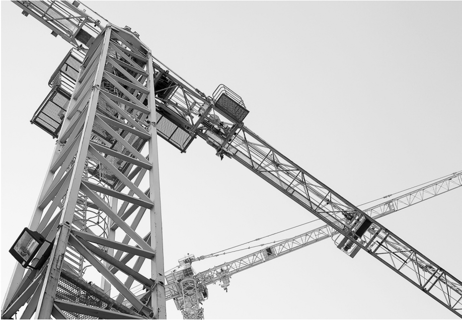
Проверки опасных производственных объектов никто не отменял

В новых эпидемиологических условиях количество проверок надзорных ведомств сократилось. Ростехнадзор не стал исключением. Однако контрольные мероприятия по-прежнему распространяются на ряд опасных объектов и иницируются в случае серьезной ситуации.