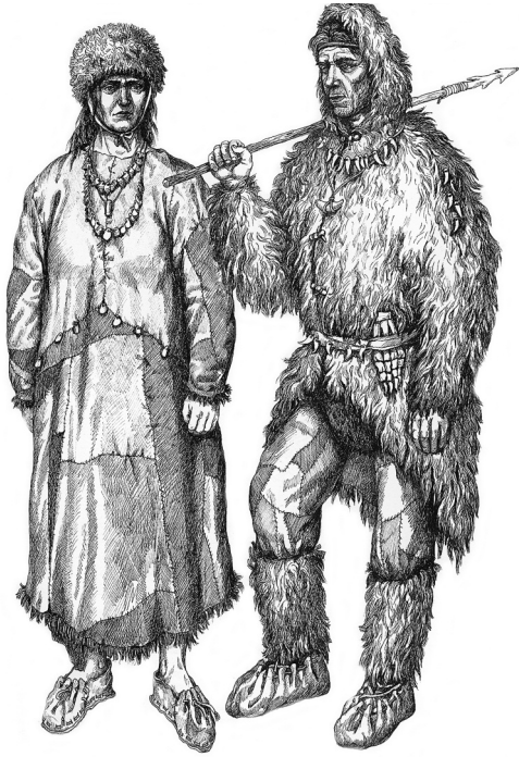
Защита была нужна человеку всегда