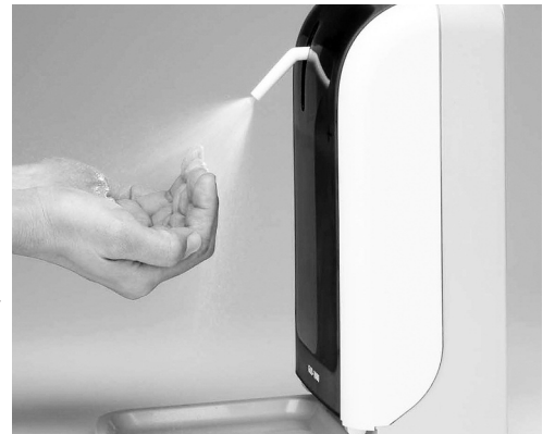
Не все антисептики качественные

Эти средства сегодня должны быть на предприятиях, в магазинах, в сумке каждого из нас. К сожалению, не все из них безопасны. Разбираемся в антисептиках.