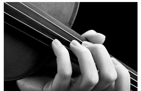
У скрипачей часто встречается струнная дискинезия

Лечение недуга длительное, пациент будет наблюдаться у невролога, врача ЛФК, реабилитолога, психотерапевта. Потребуется прием миорелаксантов, седативных средств, выполнение специальных упражнений лечебной гимнастики (кинезиотерапии), применение ор-