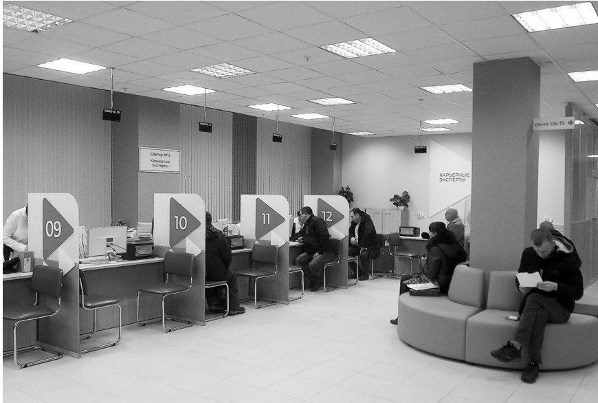
В обновленные центры занятости приятно приходить

В 2019 году были открыты 20 пилотных центров занятости в 16 субъектах Российской Федерации. Все они начали свою работу в новом едином бренде «Кадровый центр «Работа России». Что же изменилось? Во-первых, была создана современная инфраструктура, внедрены новые подходы и решения. В итоге гражданам стало гораздо комфортнее получать услуги, которые, к тому же, стали более качественными. Всё потому, что главный принцип обновленных