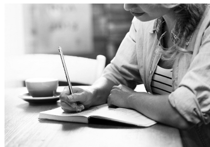
Письмо поможет избавиться от негативных эмоций

Письменное изложение своих чувств помогает избавиться от напряжения и справиться с тяжелой задачей. Это доказали американские ученые из Университета штата Мичиган. В эксперименте приняли участие студенты. Они выполняли на компьютере тест, фиксирующий точность ответов и время реакции. Перед этим половина группы испытуемых в течение восьми минут записывала свои мысли и эмоции относительно предстоящего задания. Оказалось, что именно они легче справились с тестом.