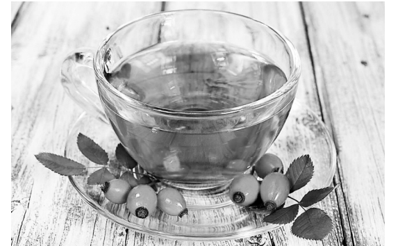
Шиповник – здоровье в чашке

Напиток из шиповника многие любят с детства. Это обязательный компонент лечебно-профилактического питания. Всё благодаря своим противовоспалительным, общеукрепляющим и тонизирующим свойствам.