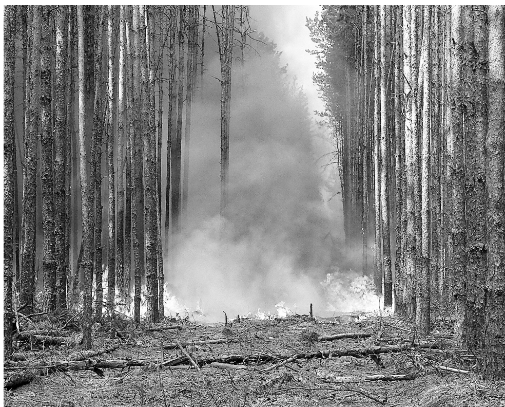
Правила помогут сохранить лесное богатство страны

Правила содержат общие требования пожарной безопасности в лесах. Также определена новая обязанность лесопользователей: юридические лица и индивидуаль-