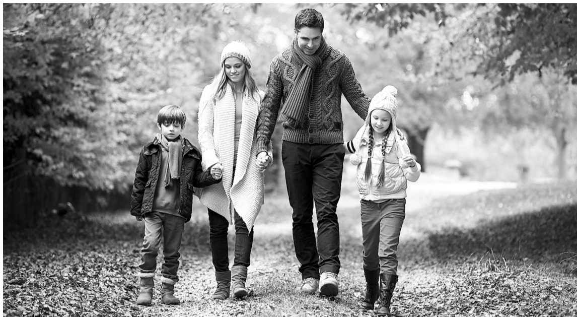
Гулять нужно минимум 30 минут в день

✓ Другие исследования показали, что ежедневная прогулка по три километра или больше может сократить риск госпитализации от тяжелого приступа хронической обструктивной болезни легких примерно в полтора раза. А еще снижает риск развития инсульта у мужчин: гуляя от часа до двух в день, можно сократить вероятность возникновения этого недуга на