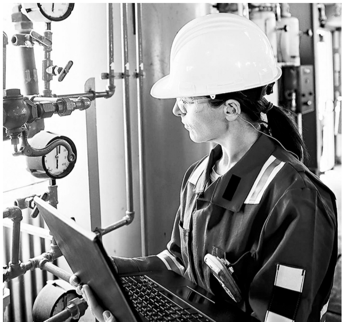
Умные технологии позволяют следить за состоянием здоровья персонала прямо на рабочем месте

Как и любая сфера, охрана труда постепенно совершенствуется. Это способствует разработке IT-компаний, позволяющие следить за состоянием и действиями персонала на расстоянии посредством специальных цифровых систем индивидуальной защиты.