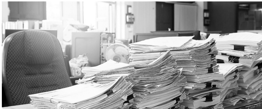
Снизить бумажный документооборот сегодня под силу любой компании

Международный день без бумаги (World Paper Free Day) отмечается во многих странах мира в начале ноября, в России – 22 октября. В этот период проводятся различные акции, направленные на сохранение лесного богатства планеты. Одна из них – российская «Неделя без бумаги». В этот период многие компании делятся опытом сокращения нерацио-