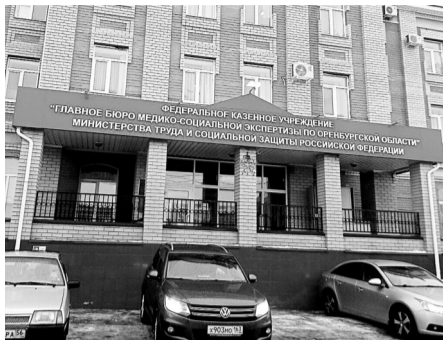
До 1 марта 2021 года бюро МСЭ будет оказывать услуги заочно

Временный порядок также предполагает автоматическое продление ранее установленной степени утраты трудоспособности на следующие шесть месяцев. Кроме того, без личного посещения бюро назначается или продлевается на полгода программа реабили-