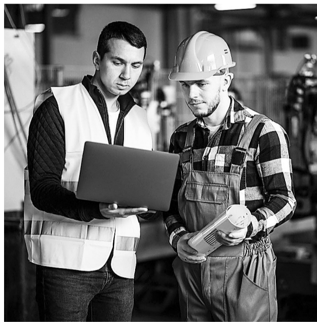
Обе процедуры направлены на идентификацию опасностей и улучшение условий труда

В настоящее время законодательство предусматривает пять вредных и (или) опасных производственных факторов, подлежащих идентификации