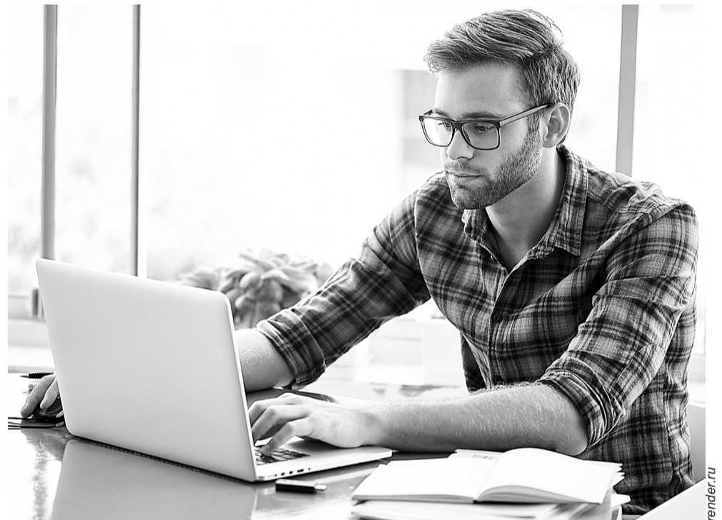
После внесения поправок в ТК РФ взаимоотношения работодателя и работника на «удаленке» станут более понятными

Сегодня в работе находится законопроект, вносящий поправки в Трудовой кодекс. Его принятие позволит отрегулировать дистанционную занятость. Как отметил министр, основная новация законопроекта в том, что он позволит совмещать работнику и работодателю режимы работы: часть времени сотрудник сможет трудиться из офиса, часть времени – из дома. Вопросы организации рабочего места и графика работы предлагается регулировать локальными нормативными актами в пределах установленной нормы часов. При этом порядок оплаты сверхурочной работы при удаленной работе должен быть таким же, как и при работе в офисе. Также, согласно докладу, в рамках законопроекта предлагается урегулировать временную удаленную занятость, что позволит ра-