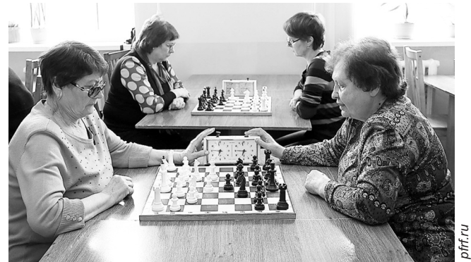
Пожилые дамы лучше справляются с тестами на мышление

Американские ученые обследовали 121 женщину и 84 мужчин в возрасте от 20 до 82 лет. С помощью позитронно-эмиссионной томографии было изучено, как их мозг снабжается глюкозой и кислородом, в итоге была найдена связь между обменом веществ в мозге и возрастом представителей обоего пола. Компьютерная программа определила, что возраст мужчин совпадал с возрастом их мозга. Однако у женщин была другая ситуация. Оказалось, что клетки их мозга были моложе возраста на 3,8 года. Вот почему, считают уче-