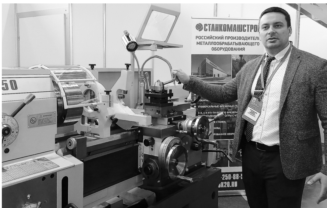
Специалисты продемонстрировали современное оборудование...

Ключевым событием форума стало Пленарное заседание «Стратегия промышленного развития. Приоритеты и успешные практики» с участием Главы Республики Башкортостан Радия ХАБИРОВА. Руководитель региона в режиме видеоконференции дал старт началу работы крупнейшей в Европе сетевой солнечной электростанции (СЭС) в Бурзянском районе.