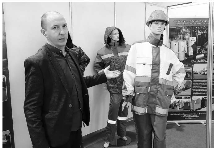
...и спецодежду российского производства