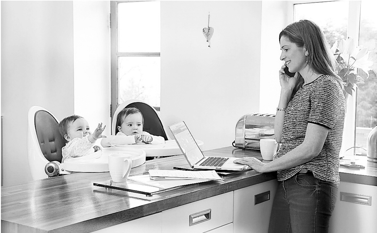
Мамочек порадовали возросшие суммы пособий

Пособия при рождении ребенка, беременности и родам, по уходу за детьми были проиндексированы. В Фонде социального страхования РФ рассказали, какие суммы будут получать семьи с маленькими детьми.