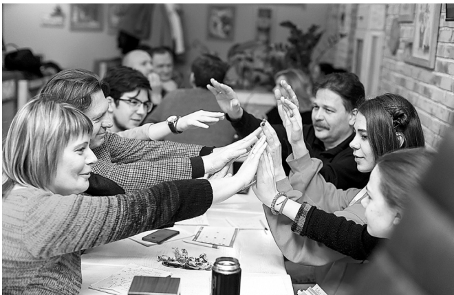
Интеллектуальные развлечения – вклад в собственное развитие

Сложно вспомнить элементарную вещь? Простой вопрос заставляет надолго задуматься? С трудом дается принятие правильного решения? Пугаться не стоит. Нужно просто развивать мышление. Психологи предлагают интеллектуальные игры для регулярных тренировок.