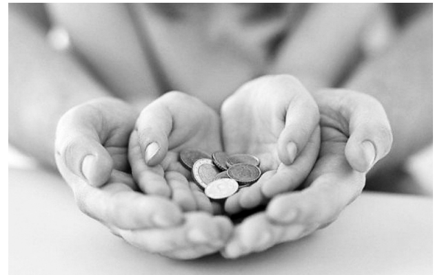
Получить пособия удалось только после обращения в инспекцию

По итогам проверки работодателю выдано предписание об устранении нарушений статей 256 и 255 ТК РФ, а также Федерального закона от 29.12.2006 г. № 255-ФЗ «Об обязательном социальном страховании на случай временной нетрудоспособности и в связи с материнством». Предписание руководством ООО «Нефтекамский механический завод» исполнено – необходимые выплаты бывшей работнице произведены.