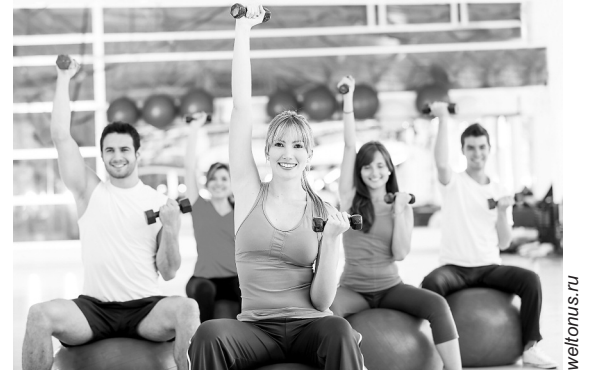
Треть респондентов желают, чтобы в соцпакет входили абонементы в спортзал

Премии, соцпакет, бесплатный отдых – какие еще привилегии на работе позволяют трудиться не покладая рук. Это выяснила Служба исследований компании HeadHunter, опросив в начале года 3600 российских соискателей.