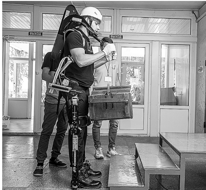
Экзоскелет предназначен для подъема, переноса и удержания грузов

По словам проектировщиков, новый интеллектуальный экзоскелет предусматривает наличие бортового компьютера, который в режиме реального времени помогает отслеживать в том числе уровень загазованности окружающего воздуха, температуру, освещенность и режим работы пользователя. Все данные выводятся на мобильное устройство или в корпоративную сеть.