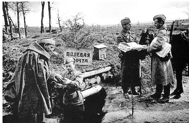
Благодаря работе почтальонов поддерживалась живая связь между бойцами на фронте и их родными

Живая связь между бойцом на фронте и его родными и близкими в глубоком тылу была важной составляющей, поддерживающей и укрепляющей моральный дух воинов Красной Армии. Поэтому, как бы ни была загружена железная дорога, почтовые эшелоны пропускались в первую очередь: этим грузам, наравне с боевым обеспечением, был присвоен приоритетный характер.