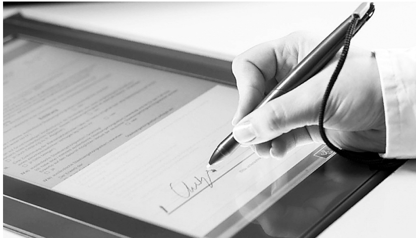
Выбор документов для использования в электронном виде целиком зависит от работодателя

Свое согласие на участие работник должен выразить работодателю в письменном заявлении. Выйти из эксперимента можно будет либо в любой момент до начала его про-