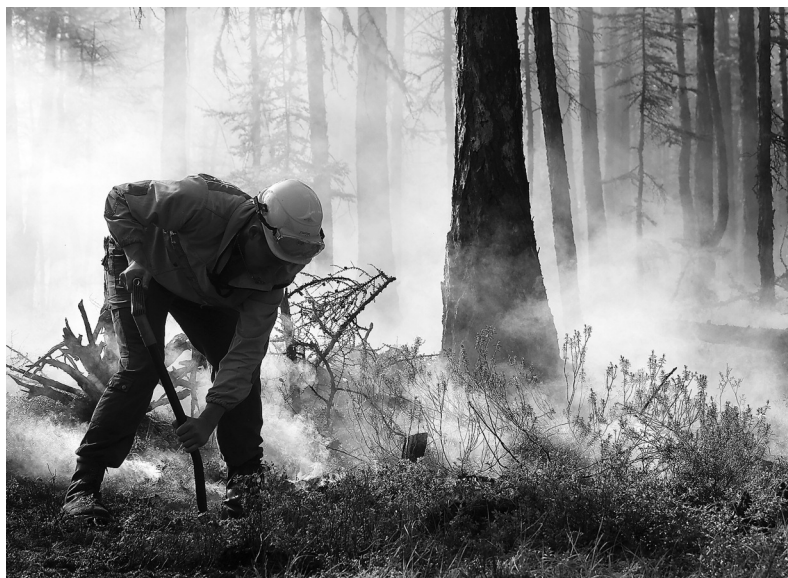
Перед майскими праздниками на территории России было зарегистрировано около 47 тысяч пожаров сухой растительности

30 апреля российские огнеборцы отметили 371 год со дня создания пожарной охраны. Современная Государственная противопожарная служба включает в себя федеральную противопожарную службу и противопожарную службу субъектов РФ. Сегодня в стране действует более 1,6 тысячи гарнизонов пожарной охраны общей численностью 549 тысяч человек личного состава. По данным сайта МЧС России, каждый год государственные инспекторы по пожарному надзору проводят 1,5 миллиона мероприятий по контролю за пожарной безопасностью и 7,5 миллиона противопожарных мероприятий. Ежегодно предотвращается до 450 тысяч пожаров, сохраняются ценности на 35–45 миллиардов рублей.