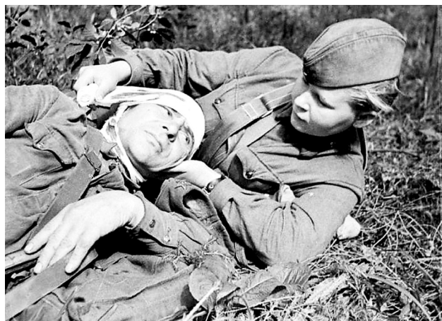
Совсем юные девушки под обстрелом перевязывали раны

За годы войны на фронте трудилось более 700 тысяч медицинских работников. Хирурги, терапевты, санитарные врачи, эпидемиологи, фельдшеры, медсестры стойко переносили все тяготы, рисковали жизнью и спасали тысячи людей. Большинству из них приходилось постоянно лезть в самую гущу сражений, для того чтобы уносить на себе тяжелораненых, а после этого в полевых госпиталях проводить сложнейшие операции, зачастую под шквальным огнем, не имея достаточного количества медикаментов и нормальных условий. Количество пострадавших и нуждающихся в неотложной помощи было так велико, что врачи и медсестры работали без передышки несколько суток подряд.