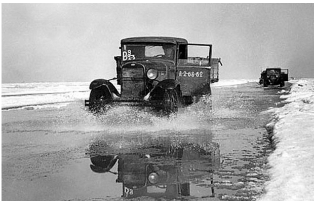
Больше 20 тысяч водителей работали в сложнейших условиях на Дороге жизни

Не только снабжение фронта ложилось на плечи военных водителей. Автотранспорт обеспечивал и крупные перегруппировки войск. Автомобиль был и узлом связи, и командным пунктом, и шасси для установки вооружения и техники, и походной типографией, и средством буксировки артиллерии. За героические подвиги и самоотверженный труд более 21 тысячи автомобилистов награждены орденами и медалями, а одиннадцать присвоено звание Героя Советского Союза.