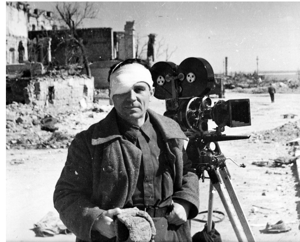
Военные корреспонденты, фотографы, кинооператоры рассказывали о мужестве и доблести наших воинов

Военные корреспонденты – это журналисты, которые сопровождали армию, авиацию и флот во время боевых действий и освещали события войны в прессе. Хотя они не были солдатами, но порой шли в атаку рядом с ними. Писали свои материалы военкоры в палатках или просто под деревьями. А потом передавали информацию в редакцию через пункты связи, к которым пробирались через зоны обстрела, бомбежки. Всё ради того, чтобы в тылу советский народ своевременно узнавал главные новости того времени: о том, как проходят бои, о мужестве и доблести наших воинов. А еще были военные кинооператоры, фотографы. Это они сделали