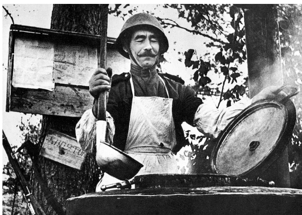
Повар считался вторым человеком после командира

Работать приходилось буквально под пулями. Но мало было приготовить, нужно было еще и доставить пищу солдатам. Если окопы находились под постоянным обстрелом противника, то горячее питание доставлялось в термосах, чаще всего один раз и ночью.