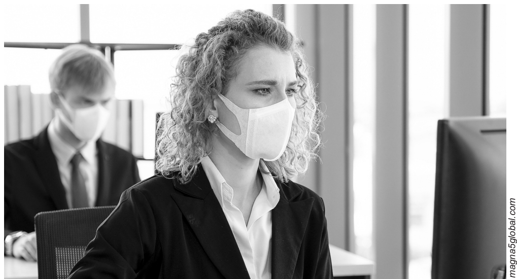
Приняв необходимые меры, можно минимизировать риск второй волны инфекции на рабочих местах

Рекомендуется провести оценку рисков и заблаговременно обеспечить на своих предприятиях строжайшее соблюдение правил охраны труда, чтобы свести к минимуму опасность COVID-19 для работников. Приняв необходимые меры, можно минимизировать риск второй волны инфекции на рабочих местах.