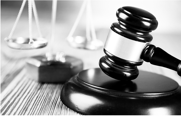
Суд принял решение в пользу работника

Если на предприятии с вредными условиями труда есть профсоюз, работникам гораздо проще разрешить трудовые и пенсионные споры. Так, благодаря юристу профкома работник «Северстали» выиграл суд у Пенсионного фонда, доказав право на назначенную досрочную пенсию.