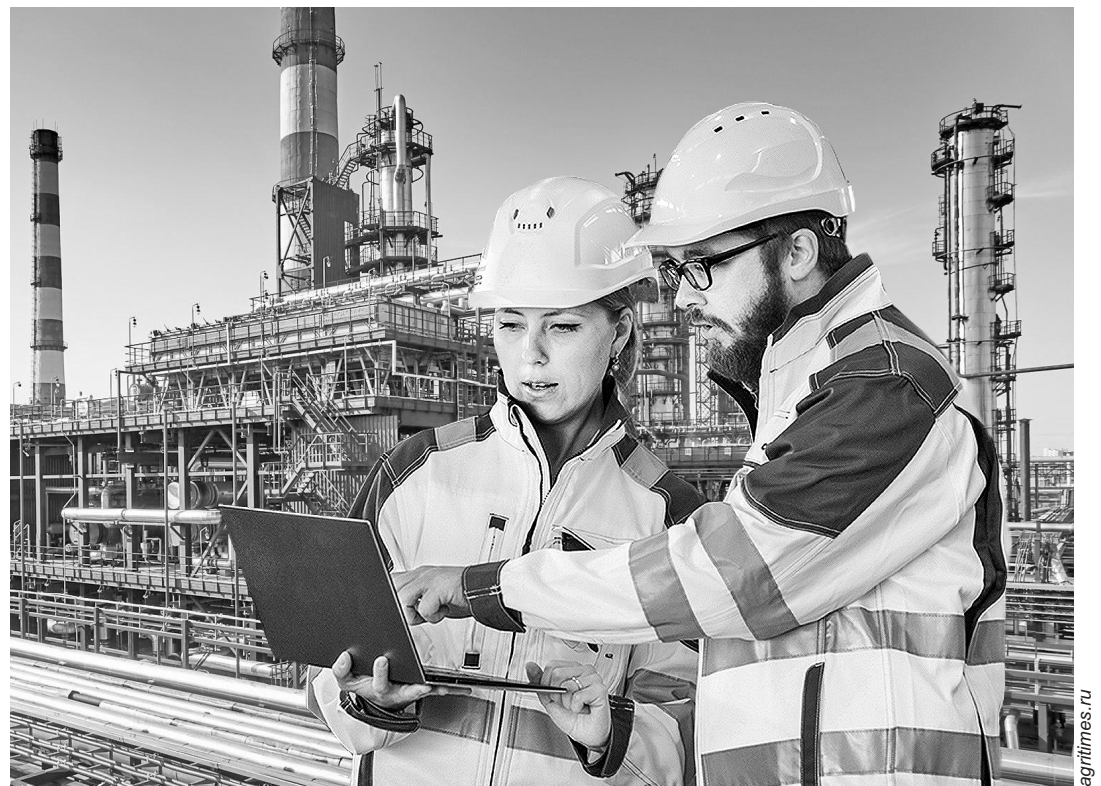
Заявление на аттестацию будут принимать через Единый портал госуслуг

Правительство РФ приняло Постановление от 13 января 2023 г. № 13 «Об аттестации в области промышленной безопасности, по вопросам безопасности гидротехнических сооружений, безопасности в сфере электроэнергетики». Документ был разработан Федеральной службой по экологическому, технологическому и атомному надзору.