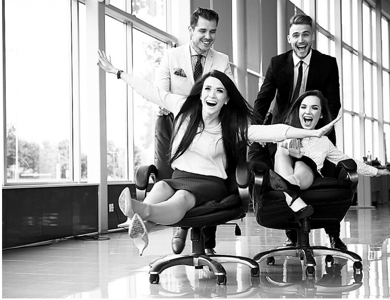
В день веселья можно устроить в офисе необычные соревнования

✓ Самое время для музыкальной паузы! Пусть в вашем офисе играют любимые мелодии. Если работа требует сосредоточенности, отлично подойдут звуки природы, если же вы трудитесь над систематическими процессами – включайте энергичные композиции.