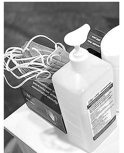
Поправки исключают из перечня антиковидные мероприятия

Проект Приказа Минтруда России определяет, что предупредительные меры будут финансироваться за счет средств Социального фонда России – правопреемника Фонда социального страхования. Связанное с этим удобство межведомственного взаимодействия позволяет сократить список документов, которые нужно приложить к заявлению о финансовом обеспечении предупредительных мер.