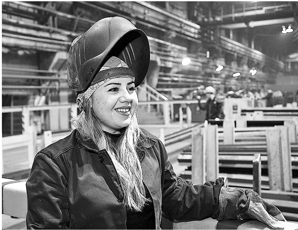
Будет обеспечена возможность самореализации женщин во всех сферах

При этом, несмотря на высокий уровень образования и занятости, разрыв в заработной плате женщин и мужчин в среднем по экономике практически не меняется и сохраняется на высоком уровне (28 процентов).