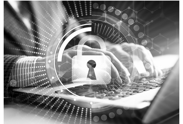
В России формируется система обеспечения информационной безопасности

28 января ежегодно отмечается Международный день защиты персональных данных. В 2023 году жители России, Беларуси и других стран мира принимают участие в мероприятиях, пропагандирующих меры по улучшению защиты данных. Их цель – обратить внимание на соблюдение правил при обращении с подобной информацией, повысить безопасность жизни граждан.