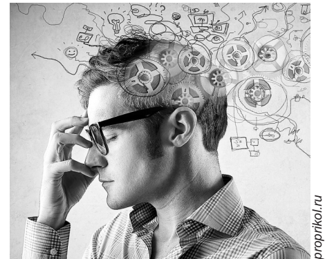
Почаще давайте мозгу отдых