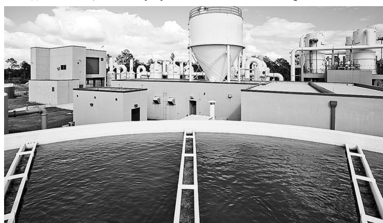
Ученые открывают все новые способы очистки воды без хлора