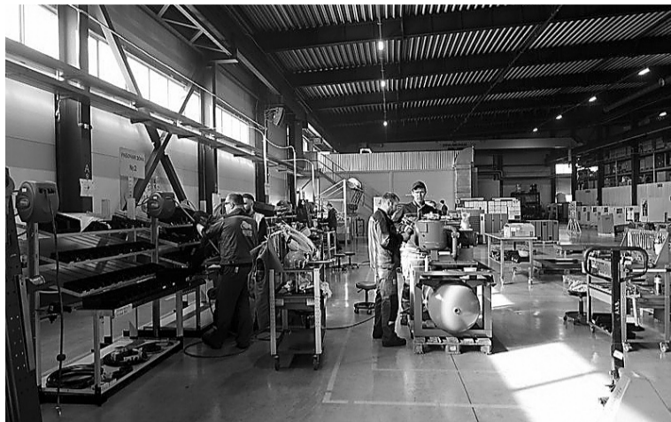
Предприятия добиваются значительного роста эффективности производственных процессов в рамках нацпроекта

Главная цель проекта – помочь предприятиям зарабатывать больше, используя те же ресурсы и то же оборудование, за счет исключения потерь. Как только сокращаются потери, растут прибыль и зарплата, уменьшается себестоимость, и компания более уверенно чувствует себя на рынке. По данным сайта Производительность.РФ, в среднем в рамках реализации проекта загрузка персонала и обо-