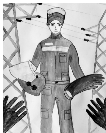
Дети – за безопасный труд!

Принять участие в конкурсе сможет любой житель Башкортостана в возрасте от 3 до 18 лет. Для этого нужно будет создать рисунок на тему безопасного производства и отправить его организаторам до 1 августа 2021 года.