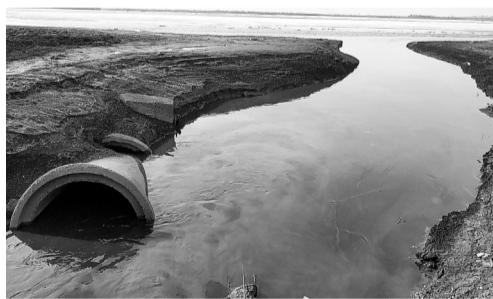
Нужно остановить рост уровня загрязнения водоемов!

Антирейтинг субъектов по качеству воды был составлен на основе анализа эффективности мер, принимаемых субъектами для восстановления водоемов. Мониторинг провела Счетная палата РФ.