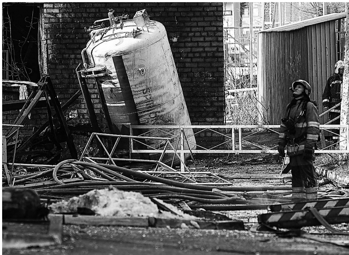
После аварии на кислородной станции в Челябинске

В отношении ООО «МагТехГаз» и ООО «Челябтехгаз», обеспечивающих поставку кислорода в ГАУЗ «Городская больница № 3 г. Магнитогорска» и ГБУЗ «Городская больница № 1 г. Ко-