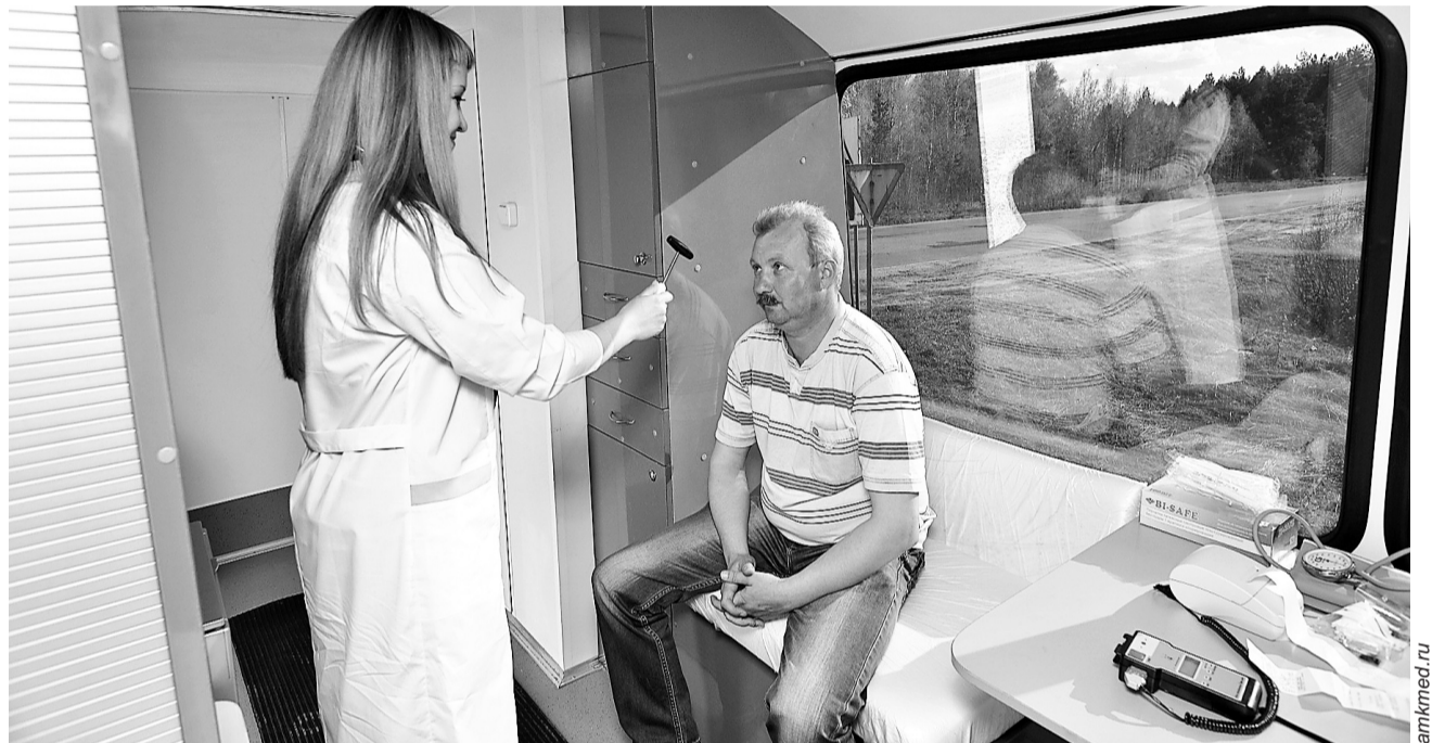
Медосмотр теперь разрешено проводить мобильными медицинскими бригадами

Приказом Минздрава России от 28 января 2021 г. № 29н утвержден новый Порядок проведения обязательных предварительных и периодических медосмотров работников, предусмотренных ст. 213 Трудового кодекса. Чем интересен для специалистов новый документ?