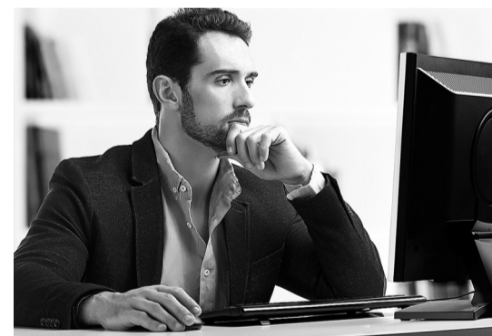
Участвуйте в конкурсе, не отходя от рабочего места

В конкурсе смогут принять участие специалисты, проработавшие в должности ответственного за безопасное производство работ с применением подъемных сооружений не менее полугода. Участников ждет компьютерное тестирование, которое начнется