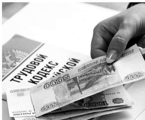
Работники должны получать зарплату в положенный срок

● Территориальный орган Роструда восстановил права 209 работников ООО «Сахалинская Мехколонна № 68». По итогам контрольно-надзорных мероприятий, проведенных инспекцией труда на предприятии, работникам была выплачена задер-