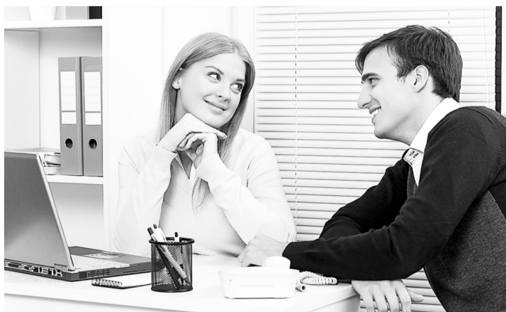
42 % опрошенных работодателей подтвердили, что в их компании есть место романам между сотрудниками