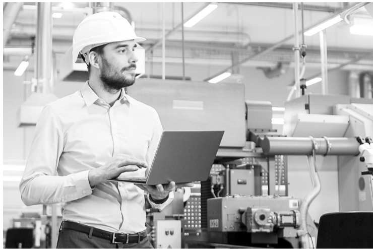
Работодателю придется самостоятельно идентифицировать потенциально вредные и опасные производственные факторы на рабочих местах

Все, кто попадает в эту категорию, могут проводить спецоценку без привлечения специализированной организации. Работодателю придется самостоятельно (совместно с работ-