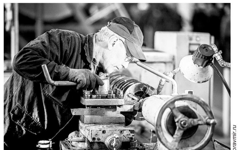
Работодателям нужно беречь работников из группы риска

Эксперт подчеркивает, что нормальная продолжительность рабочего времени – это 40 часов в неделю. Есть сокращенная – для определенных категорий работников. Важно запомнить, что при любой продолжительности рабочей недели положен непрерывный еженедельный отдых не менее 42 часов (для водителей – не менее 45 часов). То есть работа без выходных – это нарушение. Она допускается только в исключительных случаях. Работодатели же об этом часто «забывают».