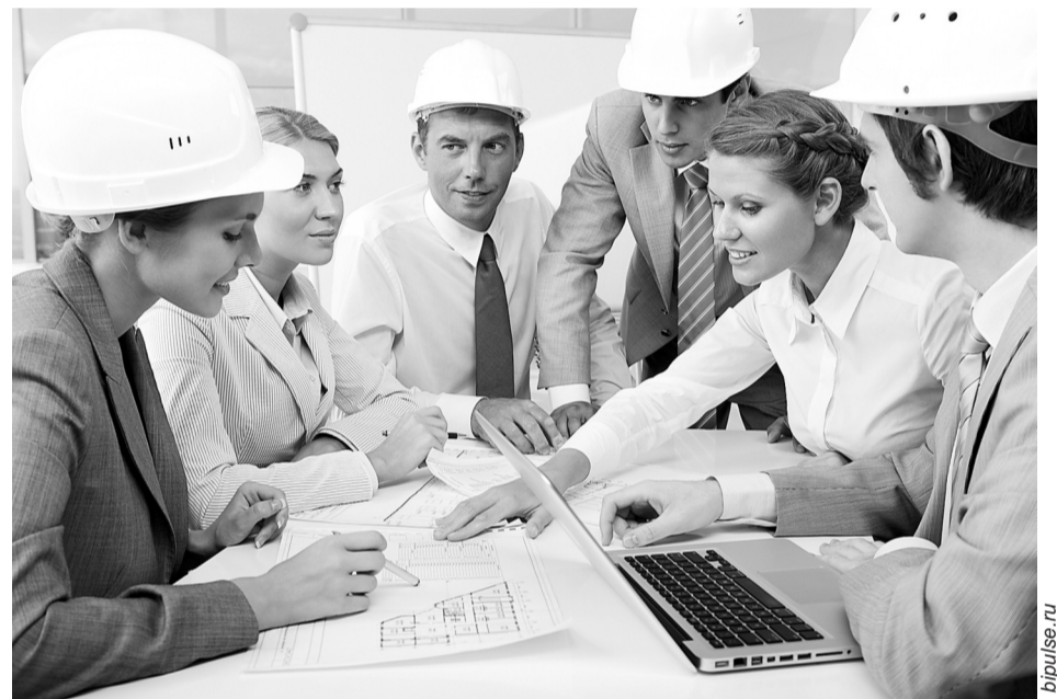
Экспертов хотят обязать проходить обучение и повышать квалификацию

Проектом предусматривается в том числе внедрение цифровых технологий в области охраны труда. Предполагается включить в Трудовой кодекс новую статью 214.3 «Личный кабинет по охране труда работодателя». Кабинеты будут создаваться на базе ФГИС СОУТ, куда без дополнительных затрат можно получить доступ через ЕСИА. Новая индивидуальная платформа