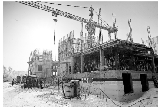
Большое число нарушений выявлено по объектам строительного надзора

Опубликован обзор часто встречающихся нарушений обязательных требований, выявляемых Федеральной службой по экологическому, технологическому и атомному надзору. Перечень, составленный по итогам прошлого года, размещен на сайте ведомства в разделе «Открытый Ростехнадзор».