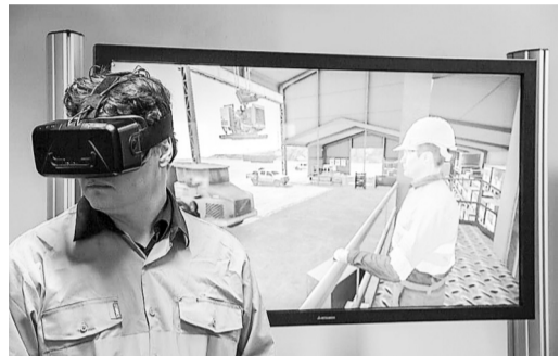
Страхователь вправе приобретать тренажеры виртуальной реальности для обучения работников за счет средств СФР

То есть страхователь вправе приобретать оборудование, обеспечивающее обучение по вопросам безопасного ведения работ. Однако для обоснования финансового обеспечения он должен представить копии технических проектов или проектной документации, которыми предусмотрено это приобретение (подпункт «л» пункта 6 Правил). При этом организация, планирующая закупить оборудование, должна быть аккредитована и включена