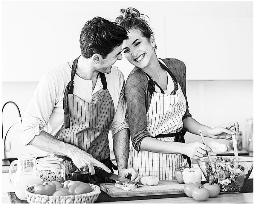
Мужчины и женщины имеют разные пищевые предпочтения

Мужской и женский организмы во многом отличаются, и, конечно, в пищевых предпочтениях тоже. Публикуем список продуктов, которые помогают мужчинам и женщинам оставаться здоровыми и молодыми.